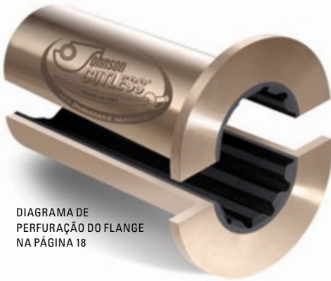
DIAGRAMA DE PERFURAÇÃO DO FLANGE NA PÁGINA 18

Os rolamentos flangeados Johnson Cutless® são de latão naval centrifugamente moldado com um flange integral para aparafusamento ao tubo da popa ou ao alojamento do suporte para reter o rolamento e impedir a rotação no alojamento. A borracha nitrílica especialmente formulado resistente a óleo e produtos químicos é seguramente ligada ao revestimento.