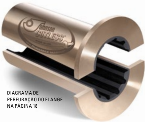
DIAGRAMA DE PERFURAÇÃO DO FLANGE NA PÁGINA 18

Os rolamentos flangeados Johnson Cutless® são de latão naval centrifugamente moldado com um flange integral para aparafusamento ao tubo da popa ou ao alojamento do suporte para reter o rolamento e impedir a rotação no alojamento. A borracha nitrílica especialmente formulado resistente a óleo e produtos químicos é seguramente ligada ao revestimento.