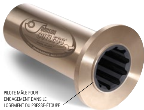
PILOTE MÂLE POUR ENGAGEMENT DANS LE LOGEMENT DU PRESSE-ÉTOUPE

Les paliers à collerette pour tube d'étambot avant Johnson Cutless® sont fabriqués en laiton naval coulé par centrifugation et disposent d'une paroi métallique épaisse avec collerette intégrée. Le caoutchouc nitrile de formulation spéciale est parfaitement collé à la coquille et résistant à l'huile et aux produits chimiques. La collerette intégrée permet un boulonnage solide du palier au presse-étoupe du tube d'étambot. Le pilote mâle usiné sur la collerette intégrée s'engage dans le logement femelle du presse-étoupe. Les collerettes sont fournies NON PERCÉES, sauf spécification contraire. Reportez-vous à la page 18 pour les « schémas de perçage ». Pour les modèles divisés ou épaulés, reportez-vous aux pages 14-17.