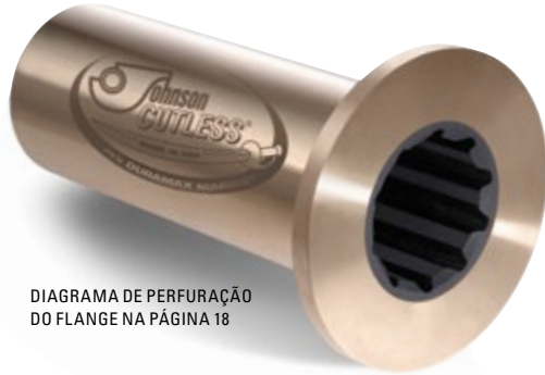
DIAGRAMA DE PERFURAÇÃO DO FLANGE NA PÁGINA 18

Os rolamentos flangeados Johnson Cutless® são de latão naval centrifugamente moldado com um flange integral para aparafusamento ao tubo da popa ou ao alojamento do suporte para reter o rolamento e impedir a rotação no alojamento. A borracha nitrílica especialmente formulado resistente a óleo e produtos químicos é seguramente ligada ao revestimento. Os revestimentos são espessos, proporcionam resistência estrutural e podem ser escalonados, se desejar. Os flanges são fornecidos SEM FUIROS a menos que especificado diferentemente. Consulte a página 18 para Diagramas de perfuração. Para estilos divididos e escalonados, consulte as páginas 14-17.