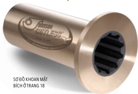
SƠ ĐỒ KHOAN MẶT BÍCH Ở TRANG 18

Các Ổ Bích Johnson Cutless® được đúc lý tâm bằng đồng thau hải quân, với mặt bích tích hợp sẵn bắt bu lông vào ống đuôi tàu hoặc vỏ bọc thanh chống nhằm giữ chặt ổ đỡ và tránh tự quay trong hộp. Lớp cao su lưu hóa chống dầu và hóa chất với công thức đặc biệt được gắn chặt vào lớp vỏ. Lớp vỏ được gia cố thành nhằm tăng sức bền cấu trúc và có thể xoay theo nấc nếu muốn. Các mặt bích đều KHÔNG-KHOAN ĐƯỢC trừ khi có chỉ định trước. Xem Sơ Đồ Khoan tại trang 18. Đối với Loại Tách Rời và Có Nấc, hãy xem trang 14-17.